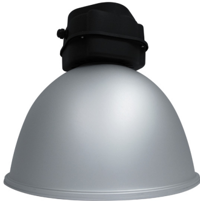
Sand Aluminum Reflector Code : 331058