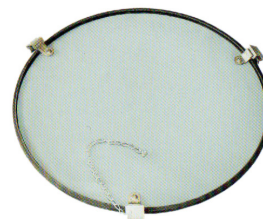
Glass Code : 331061