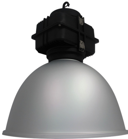
Sand Aluminum Reflector Code : 331057