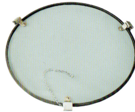
Glass Code : 331062